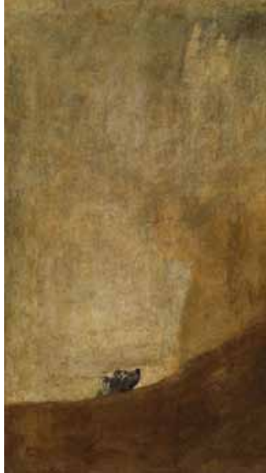
F. Goya, Perro semihundido

12.00 OFICI SOLEM- NE Col·laboren Coral Palatiolo, Associació de Pubillatge Palafolls, Banda i Cobla de Palafolls